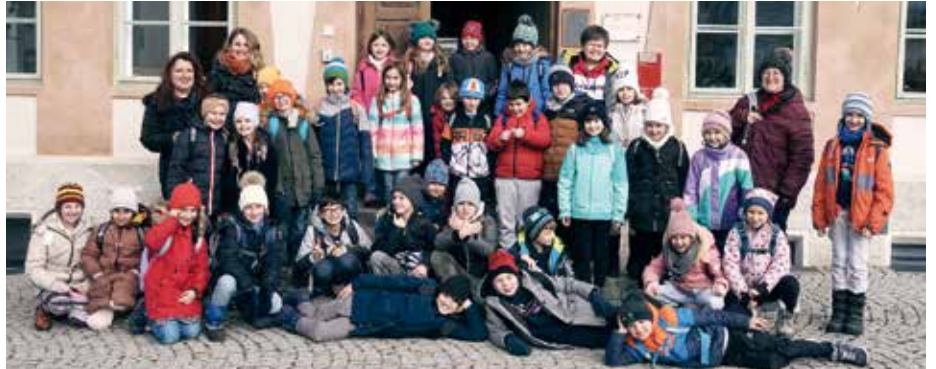
Auf dem Weg zurück in die Eichater Schule machten die beiden 3. Klassen aus Eichat noch an zahlreichen Orten im Dorf Station.