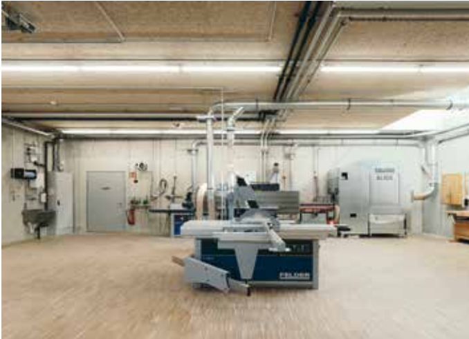
Büroräume, Sozial- und Aufenthaltsbereiche, großzügige Garagen, Waschbox, multifunktionaler Werkstattbereich, Tischlerei, ausgedehnte Lagerflächen, betriebseigene Tankstelle.