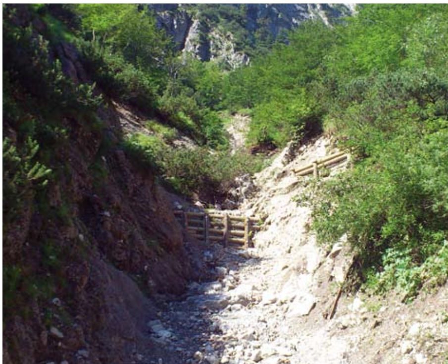
Rund 15.000 Euro kosteten die Sicherungsarbeiten: jetzt kann der Fluchtsteig wieder gefahrlos begangen werden.