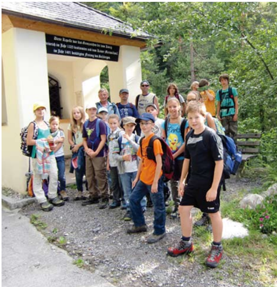
Bei prächtigem Wetter führte der Ausflug zu den Herrenhäusern im Halltal.

Mit einem kleinen Geschenk konnten alle Kinder wieder gesund und ein bisschen müde den Eltern übergeben werden. Mit einem herzlichen „Glück Auf“ bedankt sich die Kameradschaft bei allen Teilnehmern.