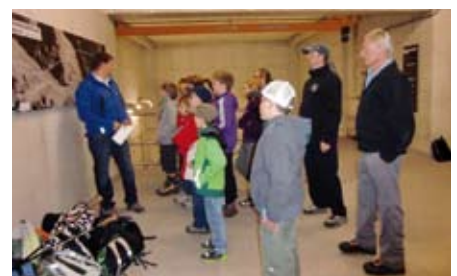
Interessantes gab es über den Trinkwasserstollen zu erfahren.

Redaktionsschluss der nächsten Absamer Zeitung: 20. August 2012