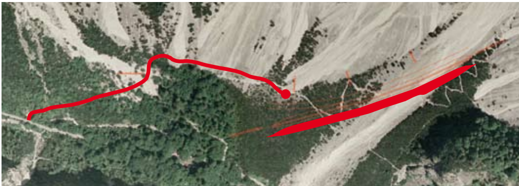
Plan: Gemeinde Absam

Die Arbeiten für das Vorprojekt zur Errichtung eines Murenabweisdammes beim Bettelwurfeck sind nun abgeschlossen. Dies wurde Anfang Juli bei der zuständigen Behörde für die Vorbegutachtung eingereicht. Mit der Übermittlung wurde um ein Koordinierungsgespräch mit Vertretern der Landesgeologie, der Wildbach- und Lawinenverbauung, der Landesumweltanwaltschaft und der naturschutzrechtlichen Abteilung des Landes Tirols gebeten. In diesem Gespräch soll das Projekt akkordiert und schlussendlich behördenfähig und baureif gemacht werden.