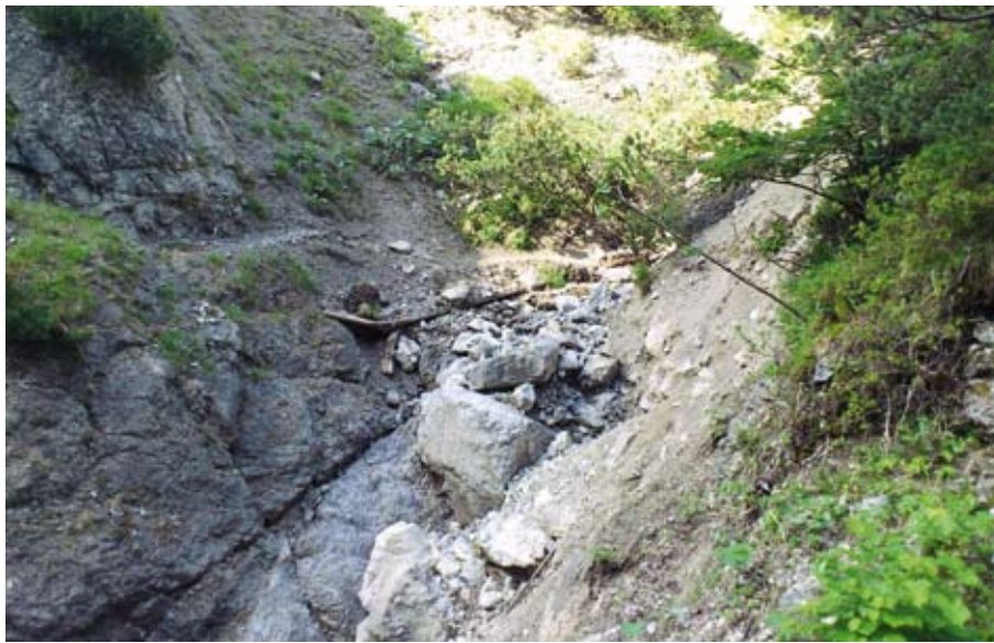
Große Schäden am Fluchtsteig richtete ein Lawine im Bereich Eibental an

Die Arbeiten selbst wurden in enger Zusammenarbeit mit der Naturschutzbehörde durchgeführt. Nach der abschließenden Begrünung des betroffenen Abschnittes ist nun der Fluchtsteig wieder zur Gänze offen.