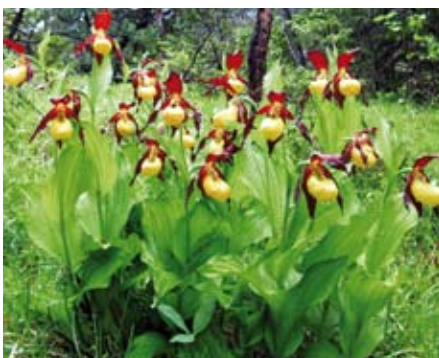
Vollständiger Stock im Mai 2011

Vielleicht regt das doch so manchen „Spatenromantiker“ zum Nachdenken an und er lässt dieses Naturjuwel, das nur noch selten vorkommt, zur Freude aller Wanderer, dort wo es hingehört.