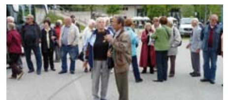
Der Obersalzberg im Berchtesgaderer Land war dieses Mal das Ziel der Absamer Senioren.