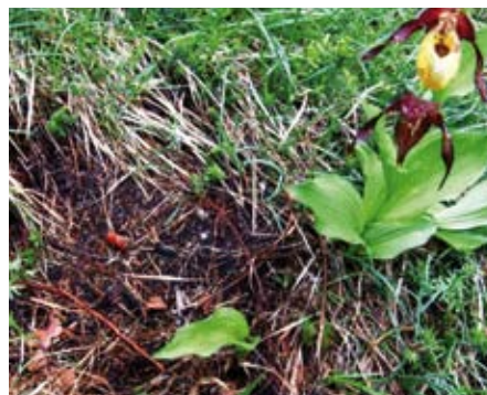
"Der traurige Rest" - ein Jahr später im Juni 2012