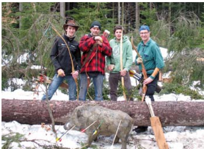
Treffsicher: Die Bogenschützen des HSV Absam