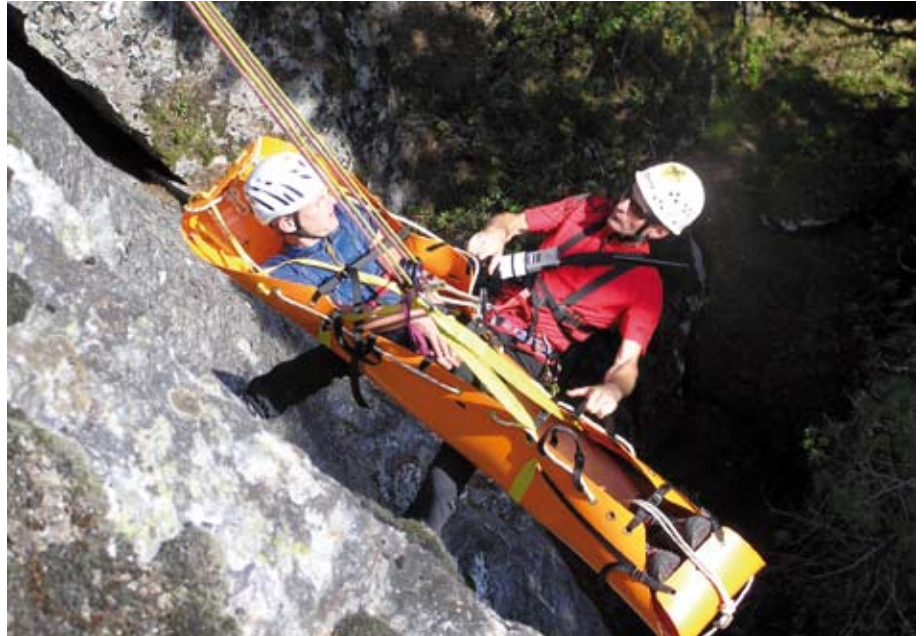
Anspruchsvolle Einsätze, wie hier im neuen Bettelwurf-Klettersteig, meistern die Männer der Bergrettung mit Routine.

Umgesetzt wurde im Jahr 2011 die längst fällige Anschaffung eines allradgetriebenen Einsatzfahrzeuges. Durch tatkräftige Unterstützung seitens der Privatstiftung der Tiroler Sparkasse sind die BergretterInnen nun in der Lage, mit einem geländetauglichen Fahr-