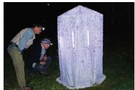
Nachtfalter aber auch Forscher lassen sich durch Kunstlicht anlocken

perten bei ihrer Arbeit über die Schulter zu schauen. Treffpunkt ist am 25. Juni 2011 um 22.00 Uhr beim Schranken am Eingang ins Halltal.