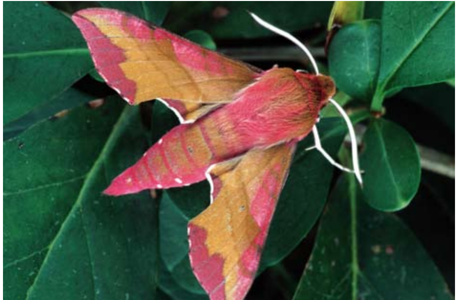
Kleiner Weinschwärmer & Co. zählen zu den attraktiven Nachtfaltern