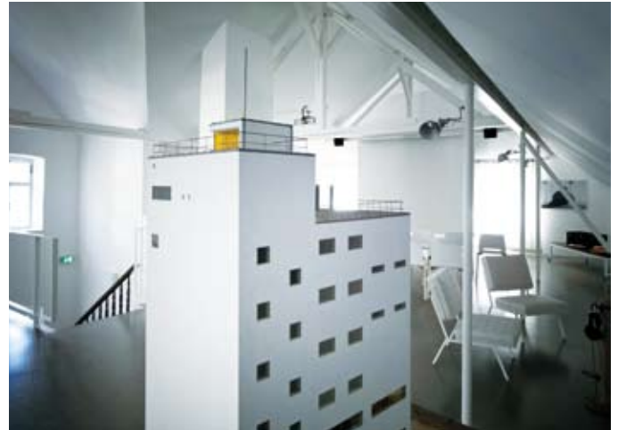
Dachboden Gemeindemuseum Absam, Ausstellung Lois Welzenbacher

Lois Welzenbacher (1889 – 1955) hat von 1945 bis 1955 in Absam gelebt. Bereits 1930/31 hatte er für Absam das »Kleine Haus bei Innsbruck« geplant. 1945 baute er auf einer Grundfläche von 6 x 6 Metern in Absam sein eigenes Haus, in dem er bis zu seinem Tod 1955 gewohnt und in einem Atelier gearbeitet hat. Im Jänner und Februar wird nun im Dachboden des Museums eine Auswahl von Architekturmodellen gezeigt. Das Thema »Architektur und