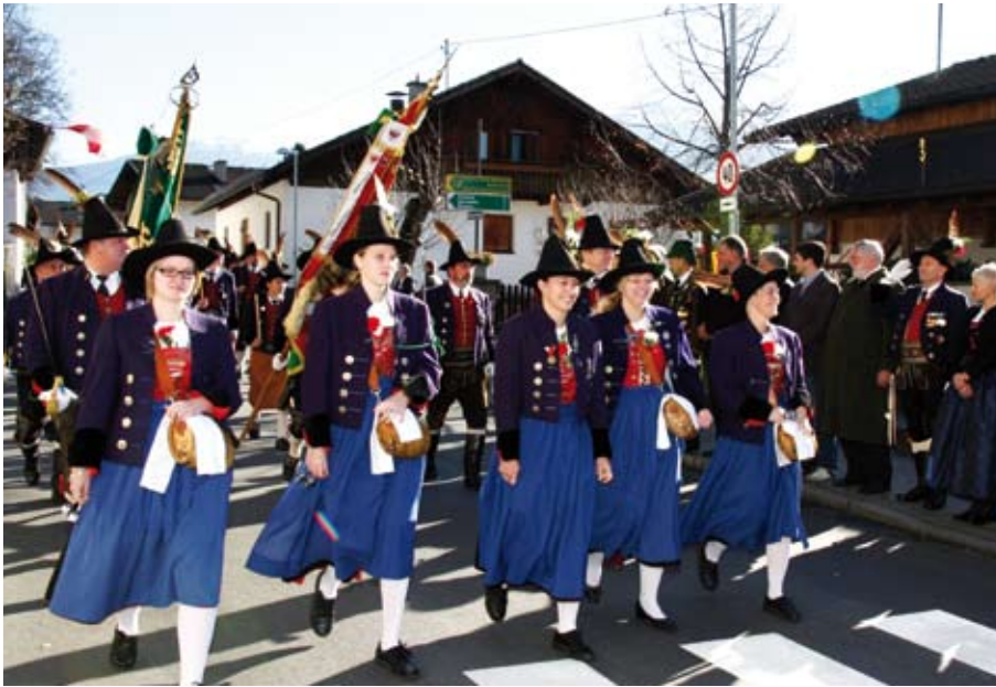
Die Schützen beim zackigen Defilee an den Ehrengästen beim Dorfbrunnen.

Die Speckbacher Schützenkompanie feiert ihren jährlichen Festtag zusammen mit der Schützengilde, begleitet von der Absamer Bürgermusik jeweils am 2. Sonntag im November. Seit 50 Jahren mit dabei auch die Freunde der Schützenkompanie Untermais-Meran und die Gebirgsschützenkompanie Mittenwald.