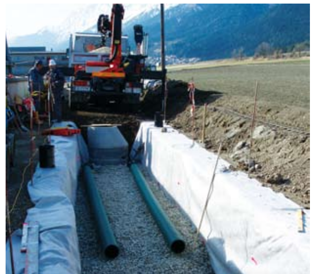
Versickerungsanlage oberhalb der VS Absam-Dorf.