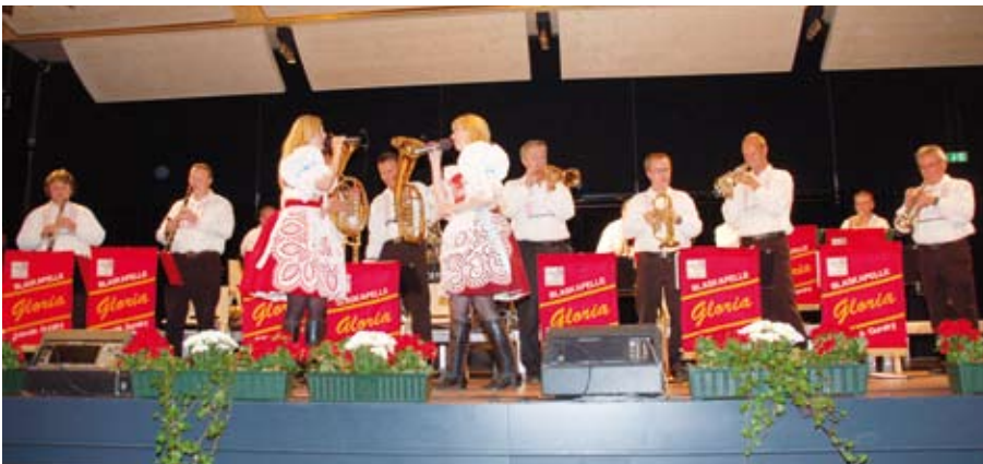
Begeisterte mit ihrem Sound: die Blaskapelle Gloria aus Tschechien.