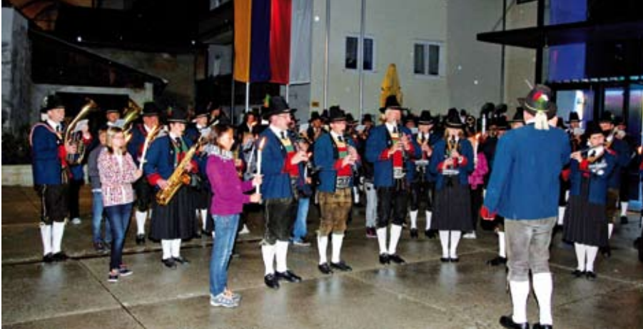
Bei leichtem Nieselregen marschierten unter Fackelgeleit der Jungmusikantinnen die Musikkapelle Thaur zum Fest ein.

Mit einem zweitägigen Fest wurde das 100-jährige Bestehen der Bürgermusik Absam am 24. und 25. September 2010 im Kultur- und Veranstaltungszentrum KiWi gefeiert.