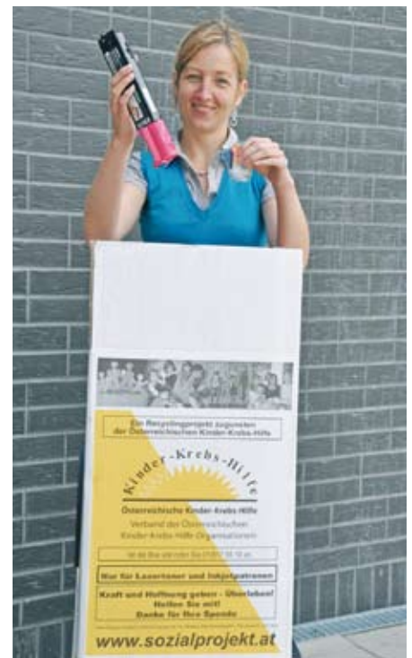
Sammeln und Helfen mit der Sonnen-Box.