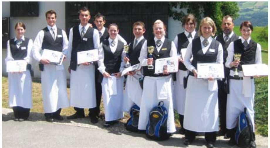
Mit herausragenden Leistungen konnten die Lehrlinge beim zum zweiten Mal durchgeführten Wettbewerb „Best Service of the Year“ die Jury überzeugen.