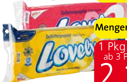
Lovely Toilettenpapier versch. Sorten, 3-lagig, 10er-Packung

Mengenvorteil 1 Pkg. 2.79 ab 3 Pkg. je 2.19 (per kg 3.15)