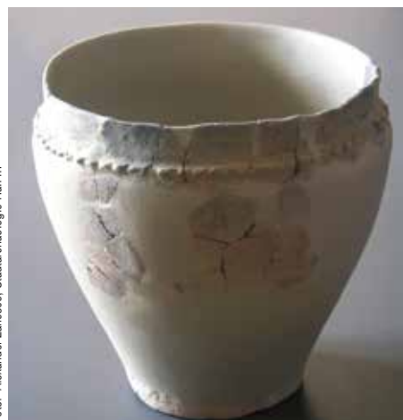
Salzsiedegefäß von St. Magdalena aus der späten Hallstattzeit