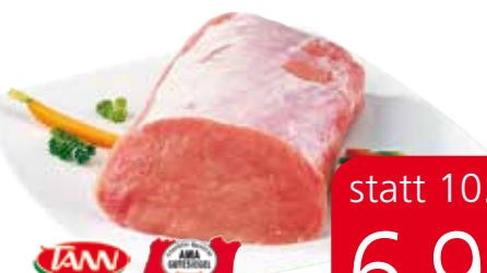
IAM Karreerose aus Österreich, vom Schwein, im Stück, ohne Knochen, nur 2-3% Fett, in Bedienung, per kg