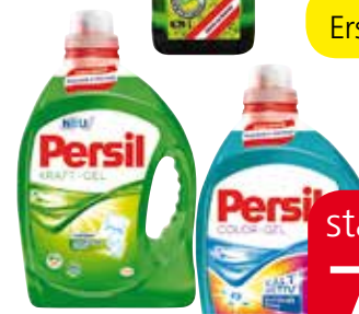
Persil Gel, Pulver, Megaperls 26-30 WG, Duo Caps 26 WG oder Power Mix Caps 24 WG