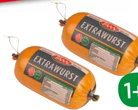
IAM Extrawurst 330 g

1 Stk. 2.19 ab 2 Stk. je 1.09 (per kg 3.30)