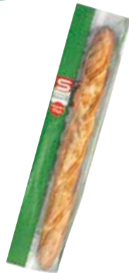
S-BUDGET Baguette 270 g