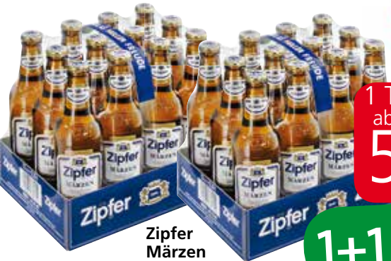
Zipfer Märzen 12 x 0,33 Liter

1 Tray 10.68 ab 2 Trays je 5.28 (per 0.5 Liter 0.67)