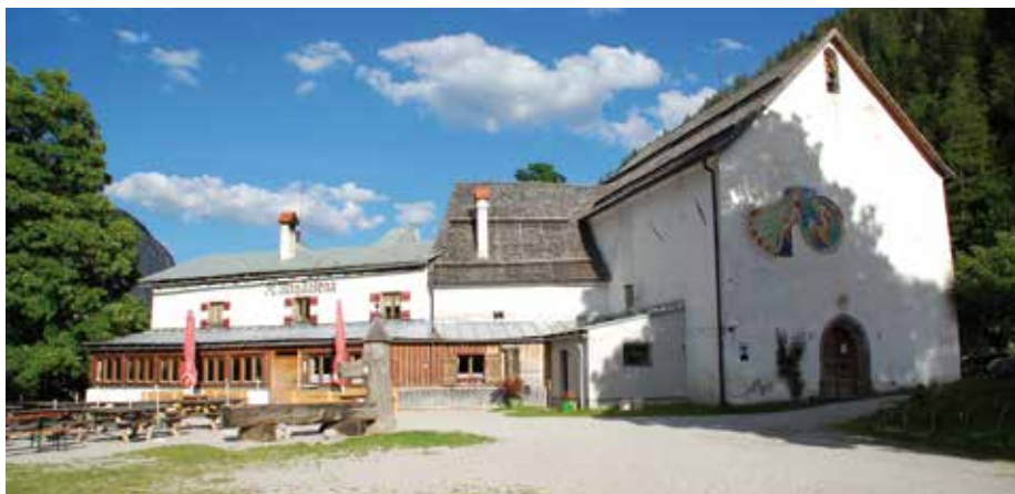
Wirtshaus St. Magdalena im Halltal