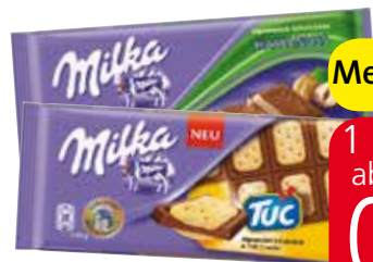
Milka Schokoladen versch. Sorten, 100 g oder 87 g

Mengenvorteil 1 Tafel 1.19 ab 2 Tafeln je 0.99 (per kg 9.99/11.38)