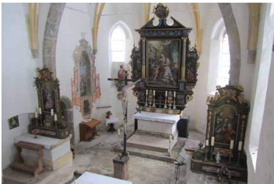
Filialkirche St. Magdalena, Innenraum