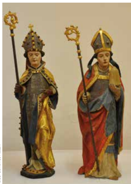
Hl. Rupert und Hl. Wolfgang

reliquiare, sowie eine Grablegung und ein Gemälde, das aufwändig restauriert wurde. Das restaurierte Ölbild stellt einen Gnadenstuhl (Dreifaltigkeit; vermutlich 16. Jhd.) dar und war ursprünglich ein Altarbild in St. Magdalena. Nur eine Reliquienbüste des Hl. Nikolaus verbleibt als Dauerleihgabe der Gemeinde Absam im Haller Stadtmuseum. „Wir werden der Stadt Hall jedoch sicherlich diese Gegenstände im Rahmen einer allfälligen Ausstellung als Leihobjekt zur Verfügung stellen“, versprach Bgm. Guggenbichler.