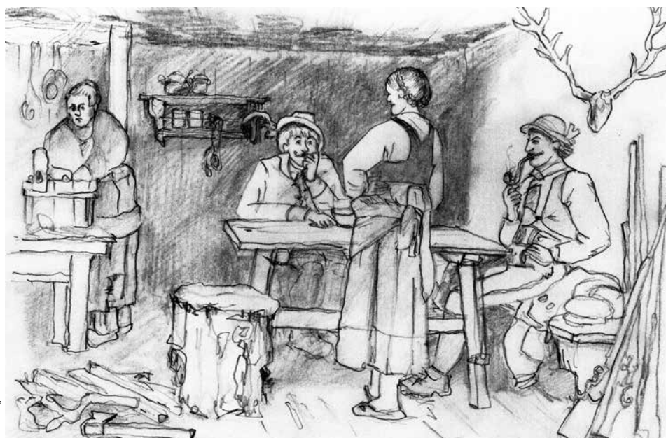
Zeichnung: Sabrina Seiwald