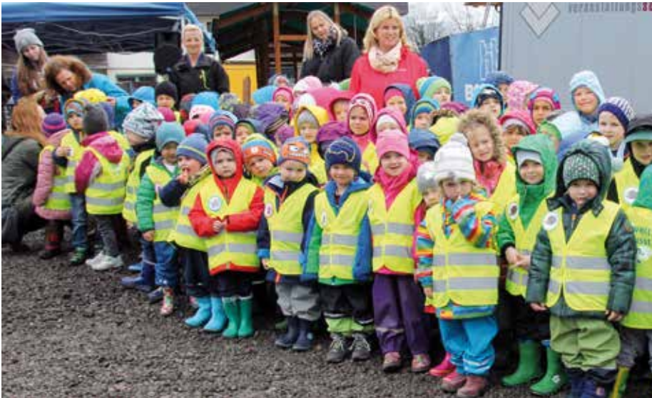
Das Handwerkerlied hatten die Kleinsten einstudiert.