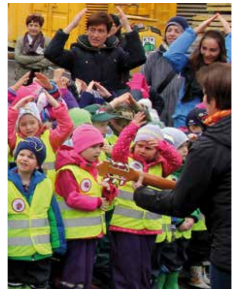
Wer will fleißige Handwerker sehen ...