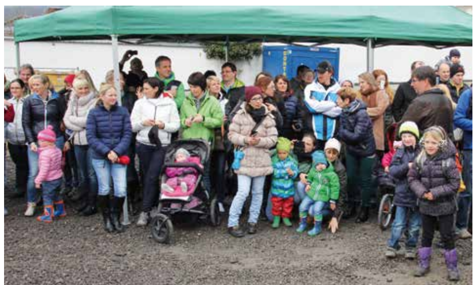
Groß war das Interesse der Eltern beim Spatenstich für das neue Kinderbetrieungszentrum.