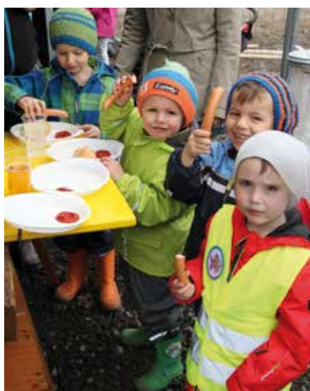
Eine kräftige Jause ...