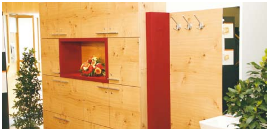
Einen Wandverbau für das Lehrzimmer entwarf die Gruppe der Produktionstechniker