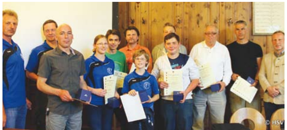
Für ihre Leistungen ausgezeichnet wurden die treffsicheren Bogenschützen.