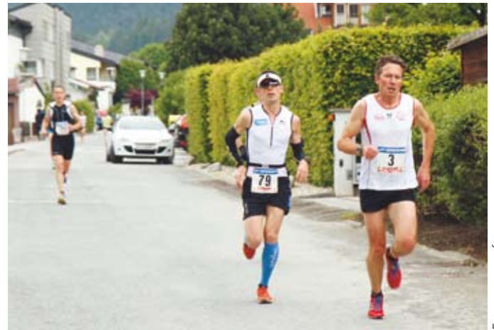
Die attraktive und anspruchsvolle Laufstrecke führt auch durch Absam