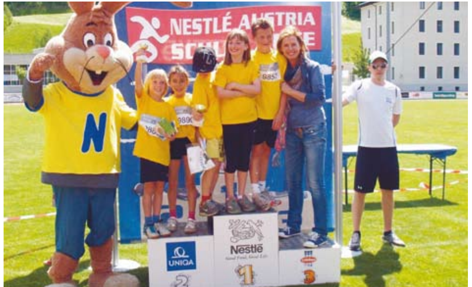
Tolle Leistungen lieferten die SchülerInnen der VS Absam Dorf beim Schullauf in Schwaz.

Der besondere Dank gilt der Gemeinde Absam für die großzügige Unterstützung auch in diesem Jahr.