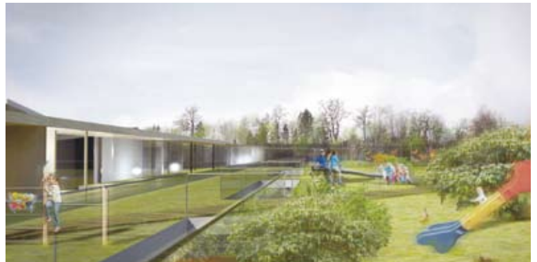
Der neu gestaltete Außenbereich modellhaft dargestellt.

„Mit dem Neubau eines neuen Kinderbetreuungsentrums am Standort der Volksschule Absam-Eichat reagieren wir auf die neuen gesetzlichen Regelungen des Tiroler Kinderbildungs- und Kinderbetreuungsgesetzes“, erklärte Bgm. Arno Guggenbichler bei der Präsentation des Siegermodells. Dieser Neubau sieht nicht nur eine Reduktion der Gruppengrößen auf 20 Kinder vor, sondern auch als zusätzliches Angebot eine Kinderkrippe für die Aller kleinsten sowie ausreichend Raum für die Nachmittagsbetreuung