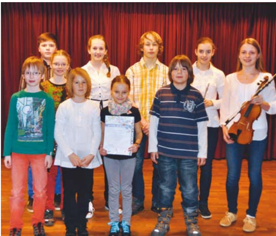
Musikalische Spitzenleistungen lieferten auch die Absamer MusikschülerInnen.