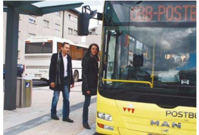
Eine moderne Bushaltestelle macht nun den Haller Bahnhof attraktiver.